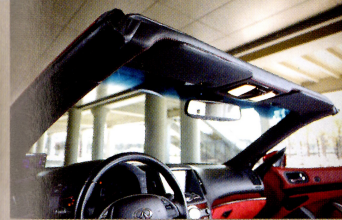
ピラーやバイザー部分はブラックのレザー&アルカンターラで張り替え。コンバータからこそ細部のコーデが大事なのだ。