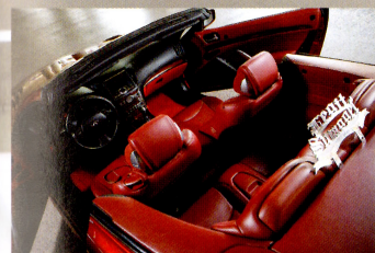
キャビンはコンバーチブルらしくレッドの内装。レッドというと派手に思われるが、ボディカラーとの同色コンビネーションは実にシック。